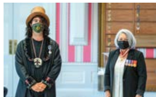
Remise d'une Médaille du service méritoire (division civile). Rideau Hall, Ottawa, septembre 2021.