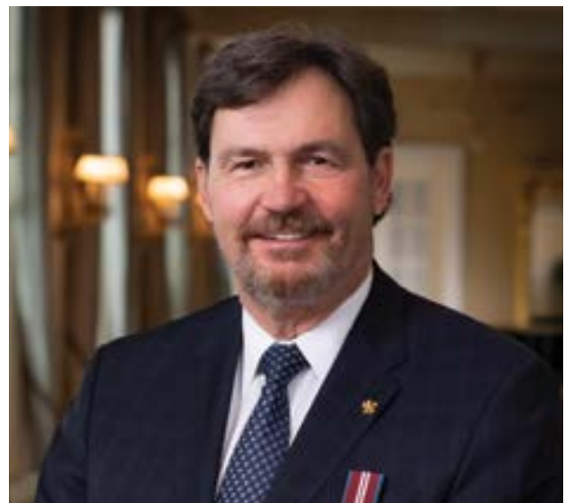
Son Excellence le très honorable Richard Wagner, C.P., administrateur du gouvernement du Canada, Rideau Hall, Ottawa, février 2021.