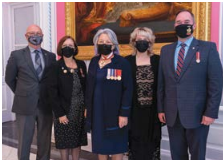
La gouverneure générale Mary Simon a remis des distinctions honorifiques à des récipiendaires, Rideau Hall, Ottawa, 2021.