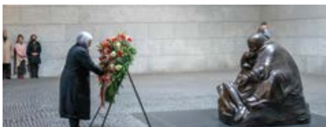
La gouverneure générale Mary Simon dépose une couronne. Mémorial central de la République fédérale d'Allemagne, Berlin, octobre 2021.