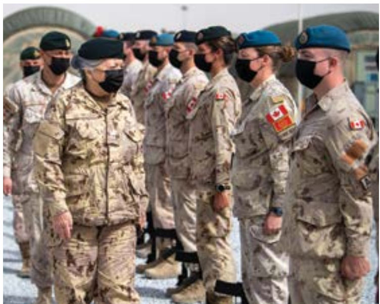
Visite du Camp Canada pour rencontrer les membres des Forces armées canadiennes qui participent à l'opération Impact. Koweït, mars 2022.