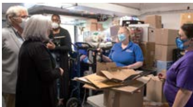
Visite à la Mission d'Ottawa, octobre 2021.