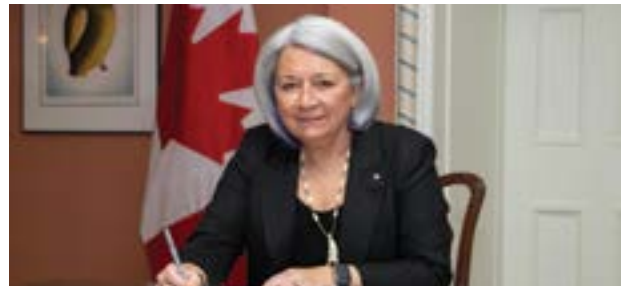
La gouverneure générale Mary Simon accorde la sanction royale au projet de loi C 4. Rideau Hall, Ottawa, décembre 2021.