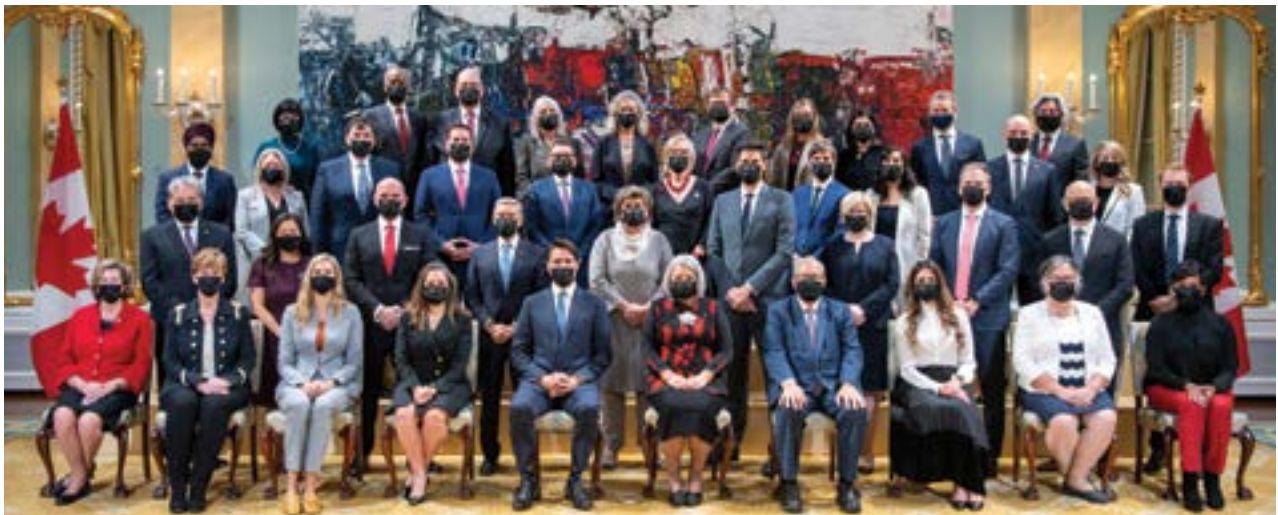
Cérémonie d'assermentation des membres du Conseil des ministres du Canada. Rideau Hall, Ottawa, octobre 2021.