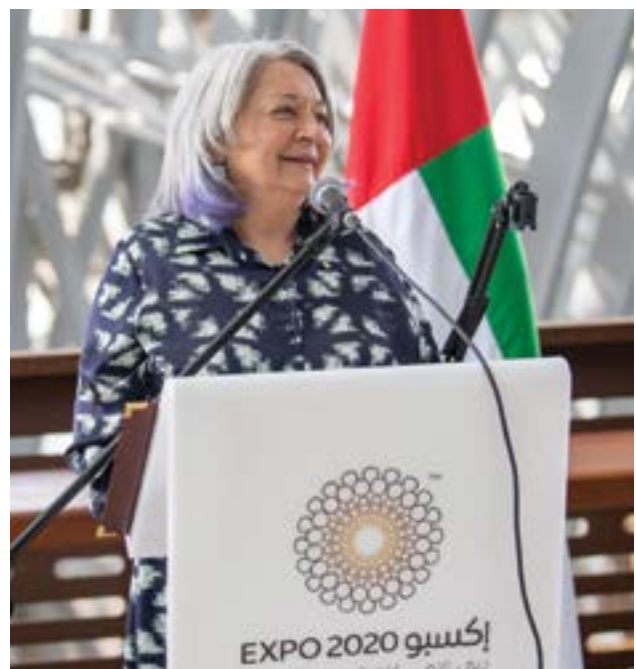
La cérémonie de la Journée du Canada à l'Expo 2020 de Dubaï. Émirats arabes unis, mars 2022.