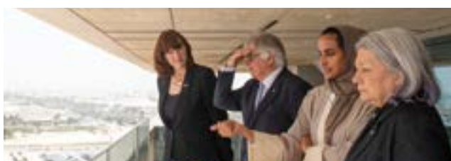
La gouverneure générale Mary Simon rencontre Son Excellence Sheikha Hind bint Hamad Al Thani. Qatar, mars 2022.