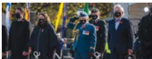
La cérémonie nationale du jour du Souvenir au Monument commémoratif de guerre du Canada. Ottawa, novembre 2021.