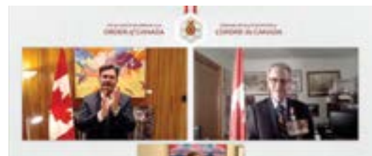
Cérémonie d'investiture de l'Ordre du Canada virtuelle, Avril 2021.