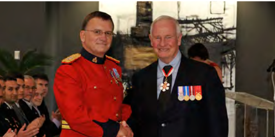
Le surintendant John Schmidt, M.O.M., a été investi de l'Ordre du mérite des corps policiers lors d'une cérémonie de remise de distinctions mixtes à la Citadelle de Québec le 18 septembre 2012.

Le gouverneur général décerne des distinctions honorifiques et des prix à des gens qui ont fait preuve d'excellence ou d'une volonté de servir le pays. L'excellence et les réalisations sont soulignées par l'entremise du Régime canadien de distinctions honorifiques et par la concession d'emblèmes héraldiques (armoiries, drapeaux et insignes).