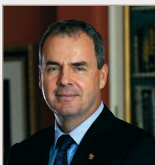
Stephen Wallace Secrétaire du gouverneur général

Le Bureau collabore étroitement avec la Commission de la capitale nationale (CCN), la Gendarmerie royale du Canada (GRC), la Défense nationale (MDN), Travaux publics et Services gouvernementaux Canada (TPSGC), le ministère des Affaires étrangères et du Commerce international (MAECI) et Patrimoine canadien (PCH).