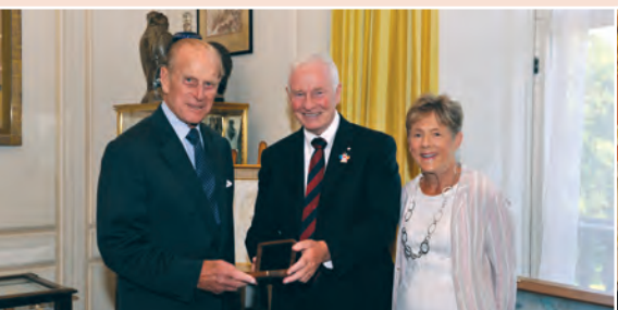
Son Excellence a remis la Médaille du jubilé de diamant à Son Altesse Royale le duc d'Édimbourg, un membre du Conseil privé de la Reine pour le Canada.