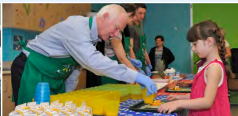
Son Excellence a aidé des bénévoles à servir le déjeuner à des élèves de l'école primaire Notre-Dame.