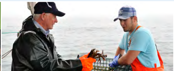
À Yarmouth, Son Excellence a participé à la pêche au homard, une activité essentielle à l'économie régionale.