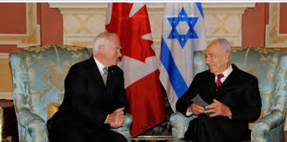
Le 7 mai, Son Excellence Shimon Peres, président de l'État d'Israël, a entamé sa visite d'État au Canada.