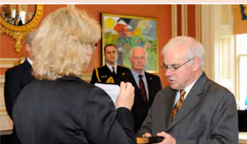
L'honorable Peter Milliken a été assermenté en tant que membre du Conseil privé de la Reine pour le Canada.