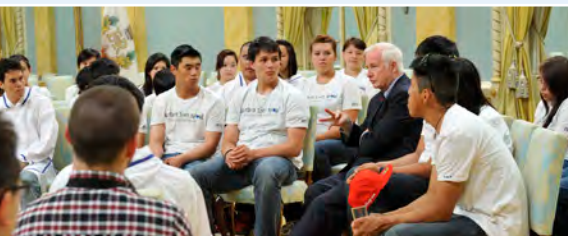
Son Excellence a animé une discussion avec des participants au programme Northern Youth Abroad de 2012.

Le gouverneur général participe à des cérémonies commémoratives, des célébrations nationales, des visites dans les provinces et les territoires et des activités communautaires partout au pays. Il est également l'hôte d'événements dans ses deux résidences officielles : Rideau Hall et la Citadelle de Québec.