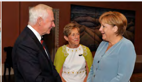
Son Excellence Angela Merkel, chancelière de la République fédérale d'Allemagne, a rencontré Leurs Excellences le 16 août.