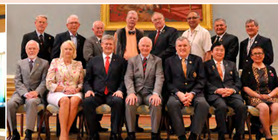
Les participants à la conférence annuelle des lieutenant-gouverneurs et des commissaires ont eu la chance de rencontrer le premier ministre à Rideau Hall.