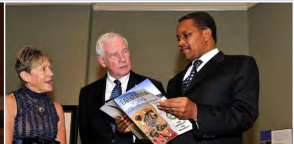
Son Excellence Jayaka M. Kikwete, président de la République-Unie de Tanzanie, a entamé sa visite d'État au Canada le 3 octobre.