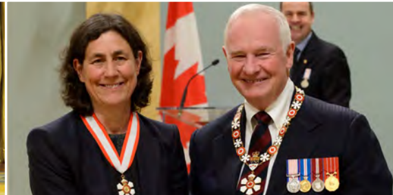
Chantal Hébert, O.C., est l'une des 44 personnes qui ont été investies de l'Ordre du Canada lors d'une cérémonie tenue à Rideau Hall le 23 novembre 2012.

Le Bureau, par l'entremise de la Chancellerie des distinctions honorifiques, administre tous les aspects du Régime canadien de distinctions honorifiques, ainsi que la Médaille académique du Gouverneur général, le Prix du Gouverneur général pour l'entraide et la Médaille du Gouverneur général pour la nordicité.