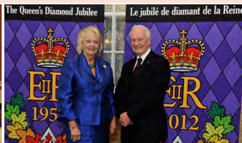
À Regina, Son Excellence a rencontré Son Honneur l'honorable Vaughn Solomon Schofield, lieutenant-gouverneur de la Saskatchewan.