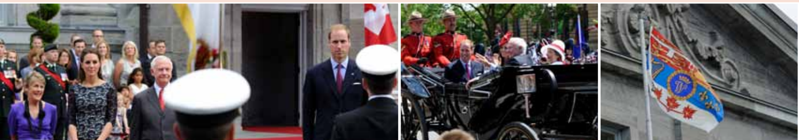
Leurs Altesses Royales le duc et la duchesse de Cambridge ont visité le Canada du 30 juin au 8 juillet 2011. Un nouveau drapeau personnel pour utilisation au Canada par le duc de Cambridge, créé par l'Autorité héraldique du Canada, a été dévoilé à Rideau Hall le 29 juin 2011.