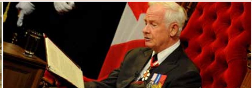
Le discours du Trône a été prononcé dans la chambre du Sénat, le 3 juin 2011.

En 2011-2012, le Bureau a appuyé plus de 95 activités liées à la représentation de la Couronne au Canada.